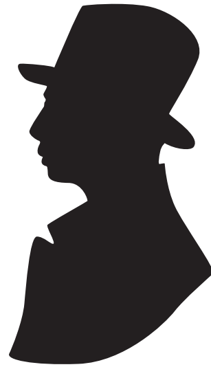
Avec un chapeau haut de forme