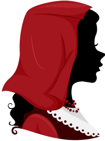
Avec des accessoires